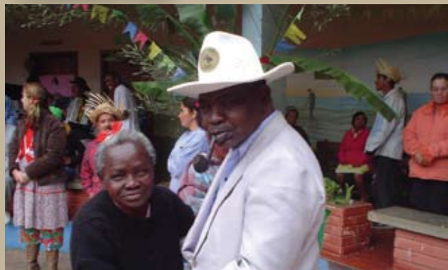
Festa junina no CHPB