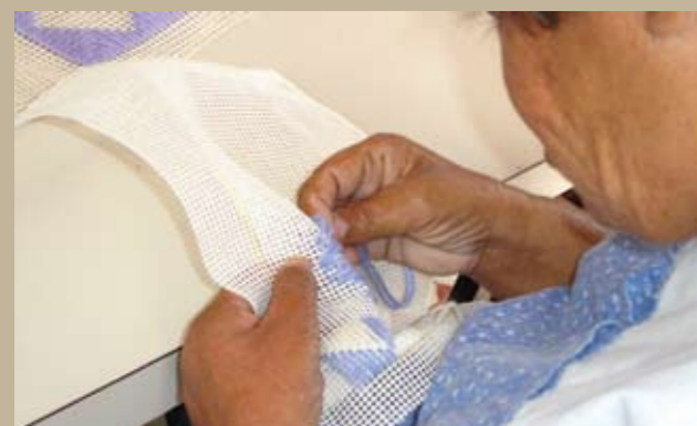
Trabalhos manuais feitos nas oficinas terapêuticas do CHPB