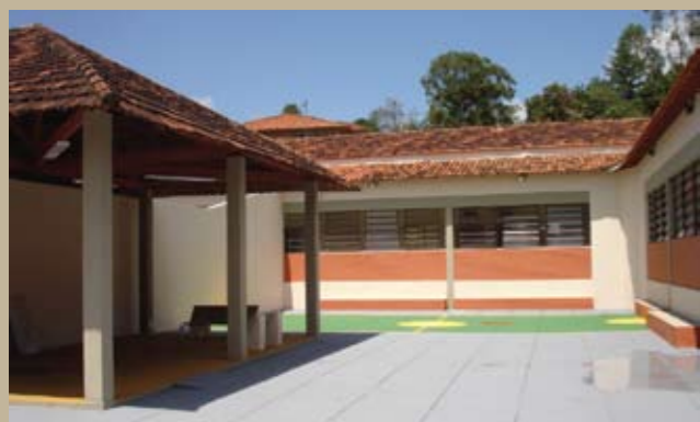
Área de laser do CHPB