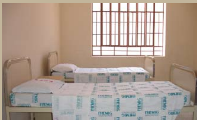
Enfermaria da Unidade de Internação de Pacientes Agudos